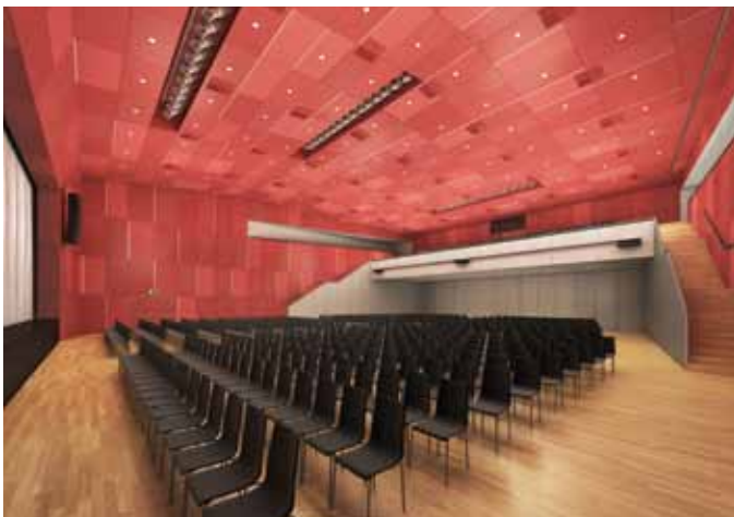
SILBERSAAL | SEITE 10 - 11