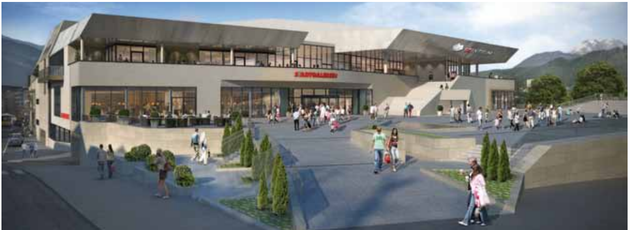
VORPLATZ | SEITE 16 - 17