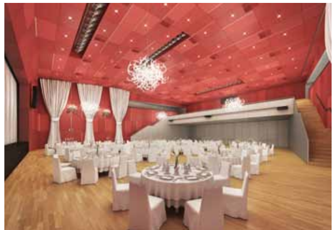
SILBERSAAL | SEITE 12 - 13