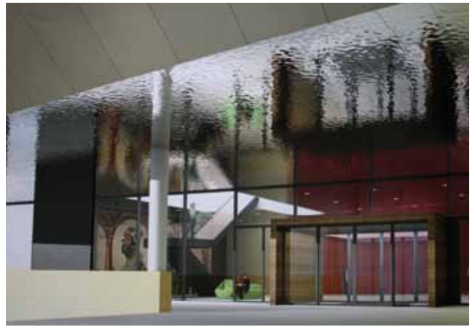
ANSICHT EINGANGSBEREICH | SEITE 06 - 07