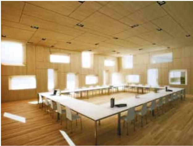
SEMINARRAUM KNAPPENSAAL | SEITE 14 - 15