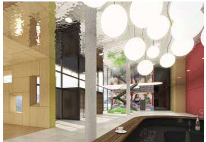
MEISTERSINGER FOYER | SEITE 08 - 09