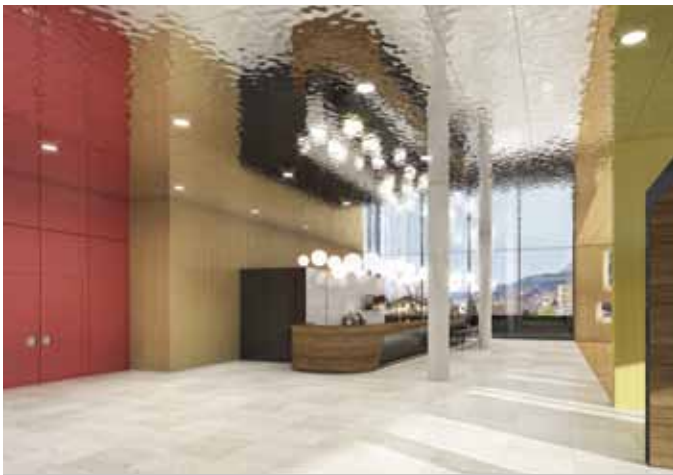
MEISTERSINGER FOYER | SEITE 08 - 09