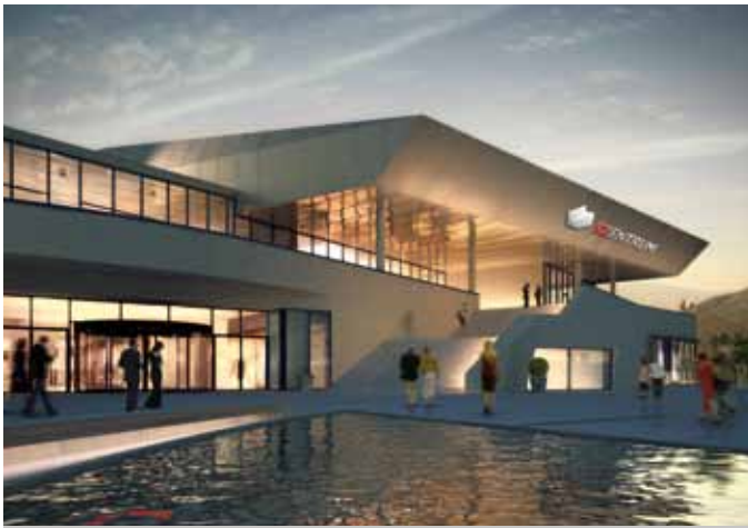
ANSICHT SÜDWEST | SEITE 04 - 05